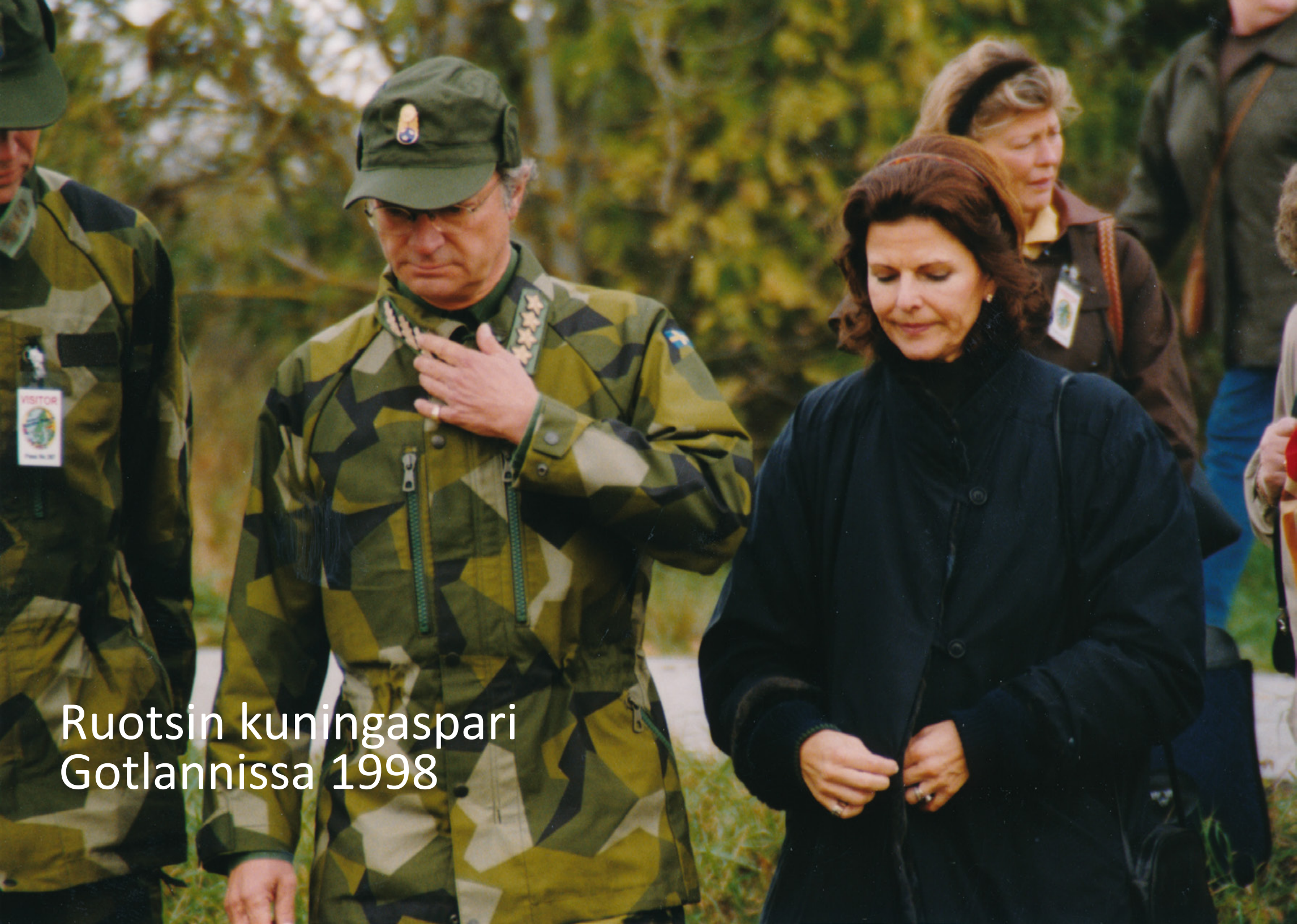
Ruotsin kuningaspari Gotlannissa 1998