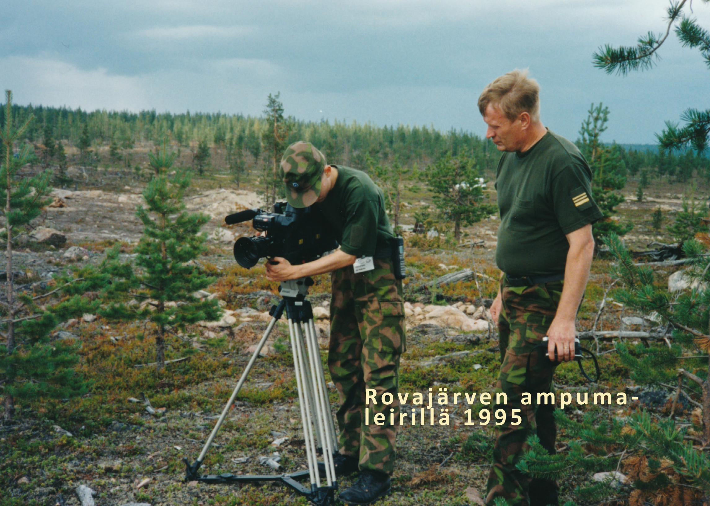
Rovajärven ampumaleirillä 1995