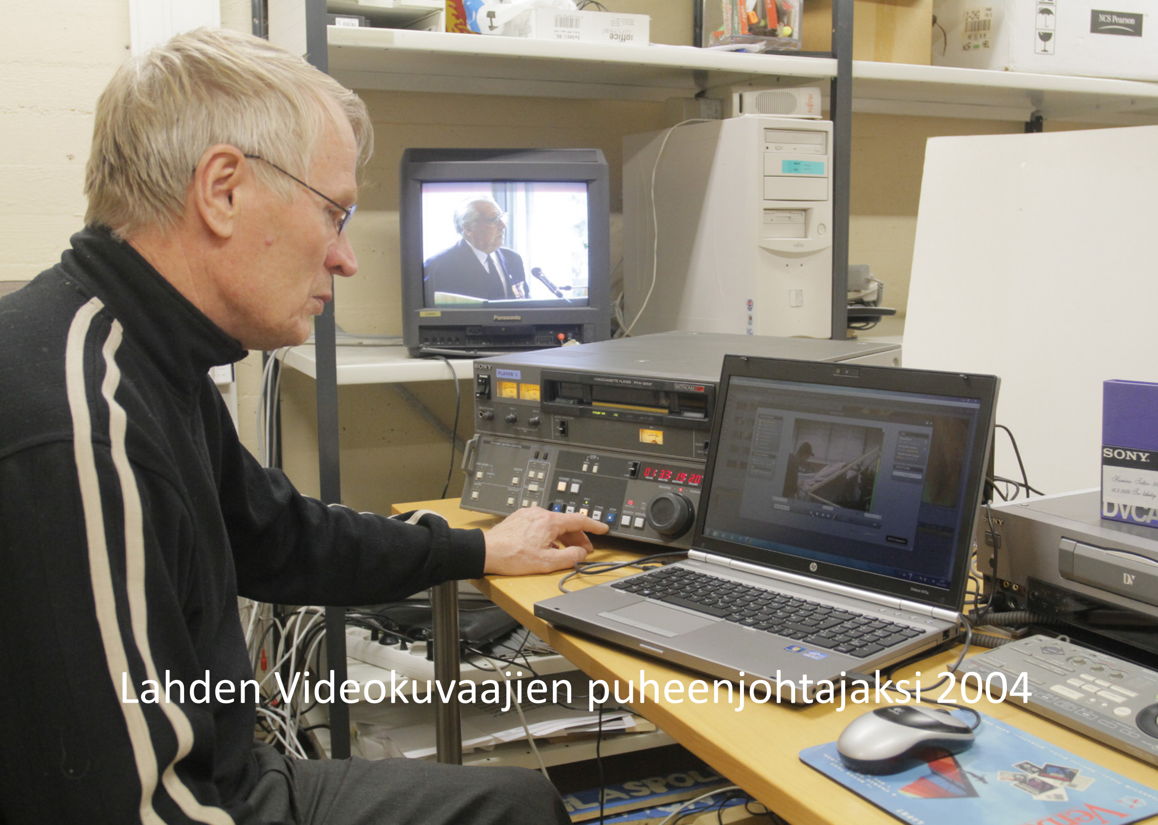
Lahden Videokuvaajien puheenjohtajaksi 2004