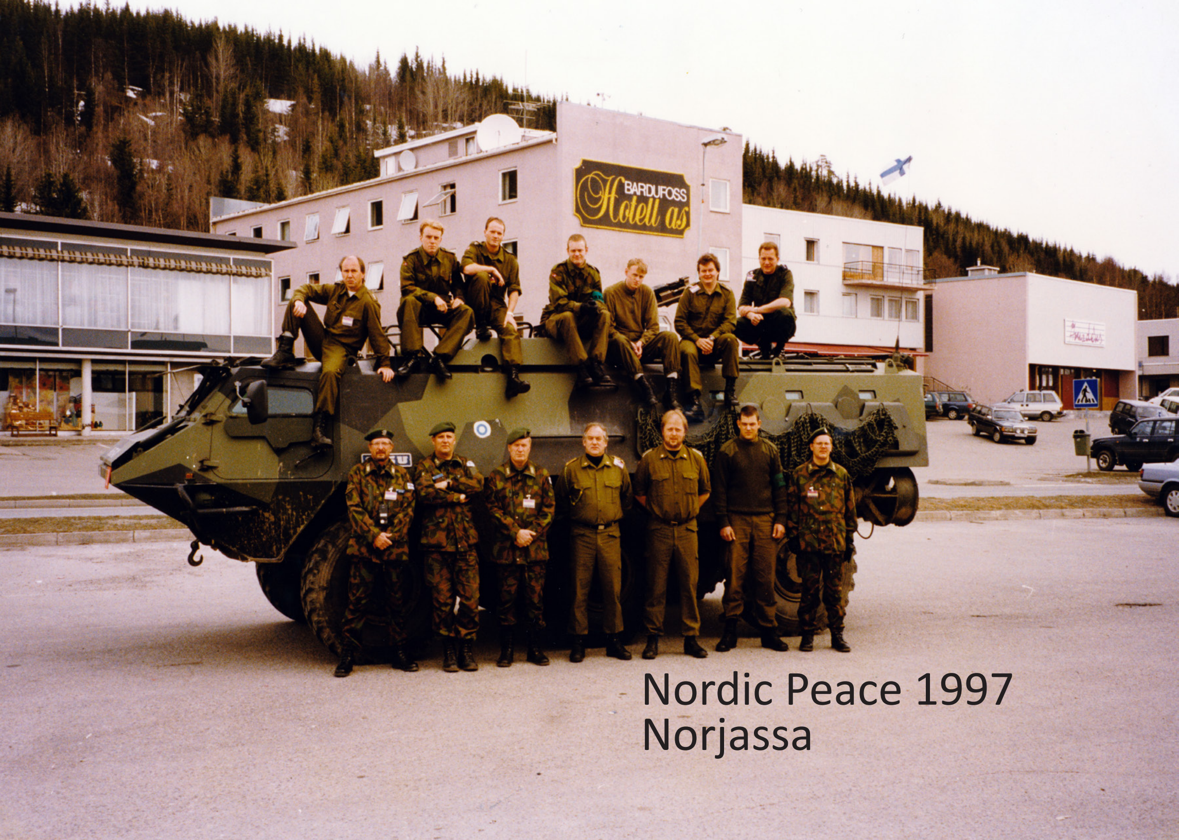
Nordic Peace 1997 Norjassa