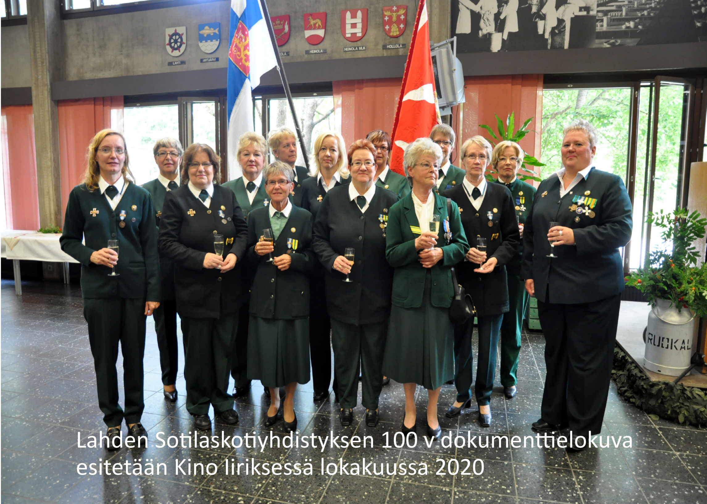
Lahden Sotilaskotiyhdistyksen 100 v dokumenttielokuva esitetään Kino liriksessä lokakuussa 2020